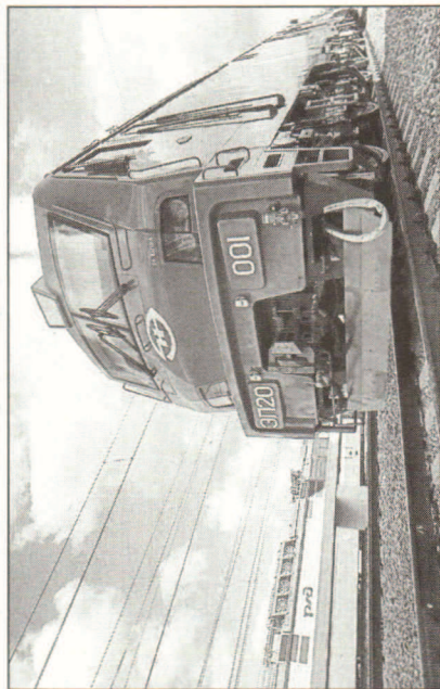
Des blocs moteurs pour la locomotive électrique

Alstom Transport et Transmashholding (TMH) ont présenté, à l'occasion de l'exposition 1520 organisée à Moscou du 6 au 9 septembre, la locomotive électrique pour trains de passagers EP20, première réalisation commune issue du partenariat stratégique noué en Russie entre les deux entreprises. Le site Alstom Tarbes conçoit la chaîne de traction et fabriquera les équipements de traction (blocs moteurs) pour les 36 premières locomotives. Les premiers blocs de pré-série "wintérisés (en version -50°C)" sont actuellement en cours de fabrication sur le site. Le bloc de pré-série n°1 vient de passer les tests avec succès la semaine dernière. Les 3 premiers blocs de traction qui constituent la locomotive de pré-série seront livrés la semaine prochaine au site Alstom de Belfort. Alstom et Promeltronica envisagent la création d'une société commune dans le domaine de la signalisation ferroviaire