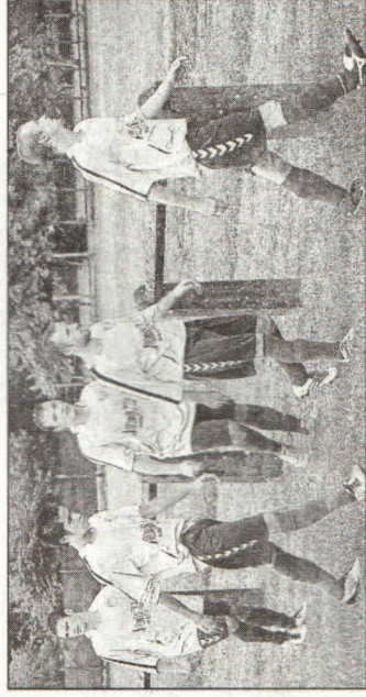
Les hommes de Quéré devront se ressaisir dans deux semaines à Barbazan-Debat.