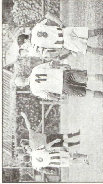
L'ASCB en difficulté (ici contre le FC Nestes)

La section Foot de l'ASCB a plutôt mal commencé la saison 2011-2012. Après son élimination récente en coupe de France contre le FC Nestes (4 à 2), les barbazanais d'Eric Quéré sont allés subir une cuisante défaite 4 à 0 contre les footballeurs de Juillan ce samedi 10 septembre. Le match était malheureusement à sens unique et il s'en est fallu de peu que le score ne soit plus large. Les tirs des juillanais ont en effet heurté les montants de