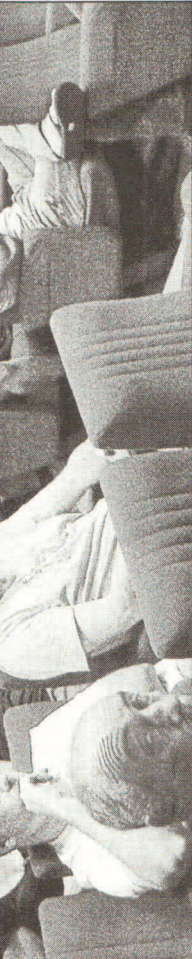
Le public est nombreux à s'intéresser à ce projet.