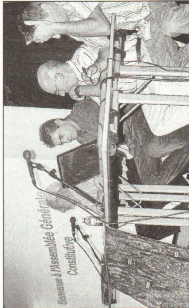
Lors de l'assemblée constitutive de juin 2011.