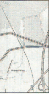
Le projet prévoit de passer près des habitations.